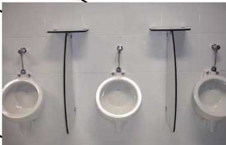
Tapa-Vista de Mictório