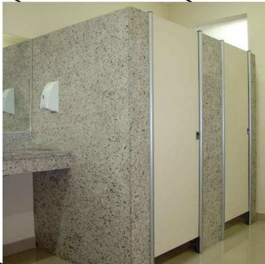
Box sanitário com parede de granito